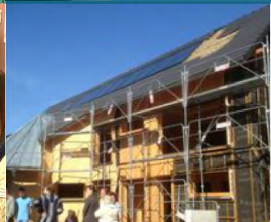
Iniciar un proyecto de co- vivienda. Ungersheim, Francia