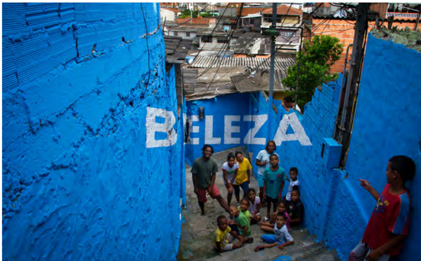
Proyecto de arte comunitario en Brasilândia, una favela de São Paulo, Brasil, coordinada por Transición Brasilândia.