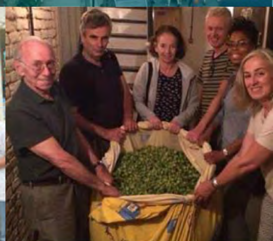
Iniciar un Club de Salto Crystal Palace, Londres, Reino