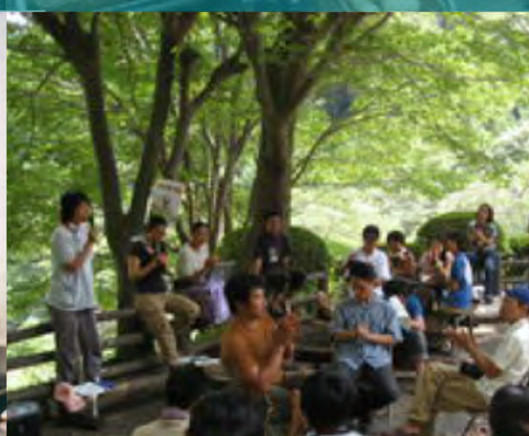
Mantener un Open Space comunitario Fujino, Japón