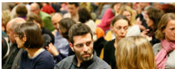
Los participantes se presentan unos a otros en el evento de Transición Luxemburgo.

Este es un buen momento para registrarse como una iniciativa en la Red de Transición, es un proceso muy sencillo. Además deberías apuntarte al boletín de la Red de Transición para que te mantengas al tanto de las noticias y desarrollos. También podrás averiguar qué otras iniciativas existen cerca de ti y hacer contacto con ellas, o con tu red regional, si es que existe.