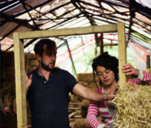
Aprender construcción natural Transition Heathrow, Reino Unido