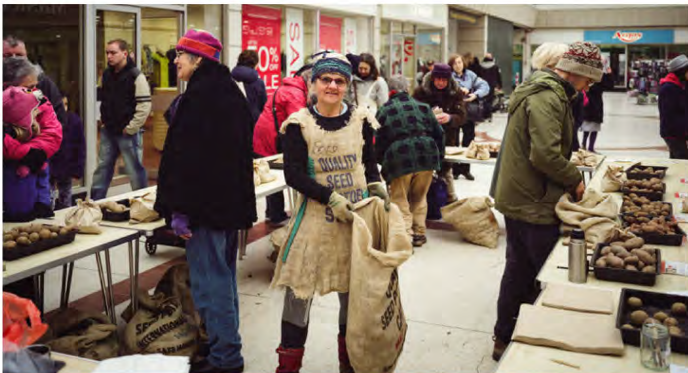
"Día de la Patata" de Transición Stroud en un centro comercial local.