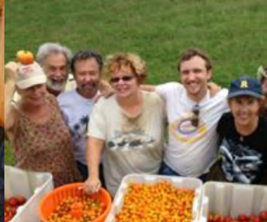
Organizar un 'Recogida de Alimentos' Sarasota, Estados Unidos