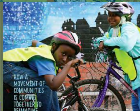
Encuentre más en nuestras '21 Historias de la Transición'. Anywhere!