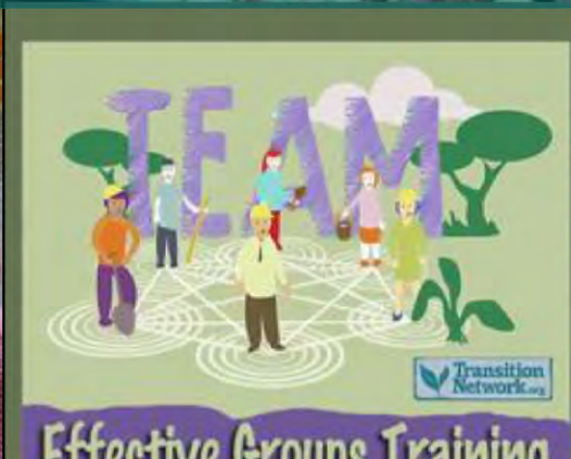
Hacer algún Entrenamiento de Transición ¡En cualquier parte!