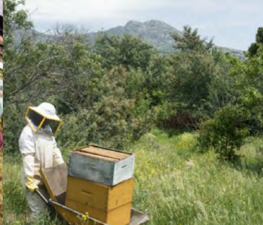
Apicultura comunitaria Zarzalejo, España