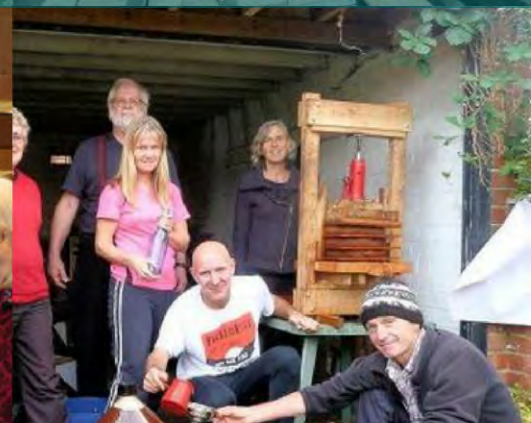
Hacer jugo de manzana Loughborough, Reino Unido