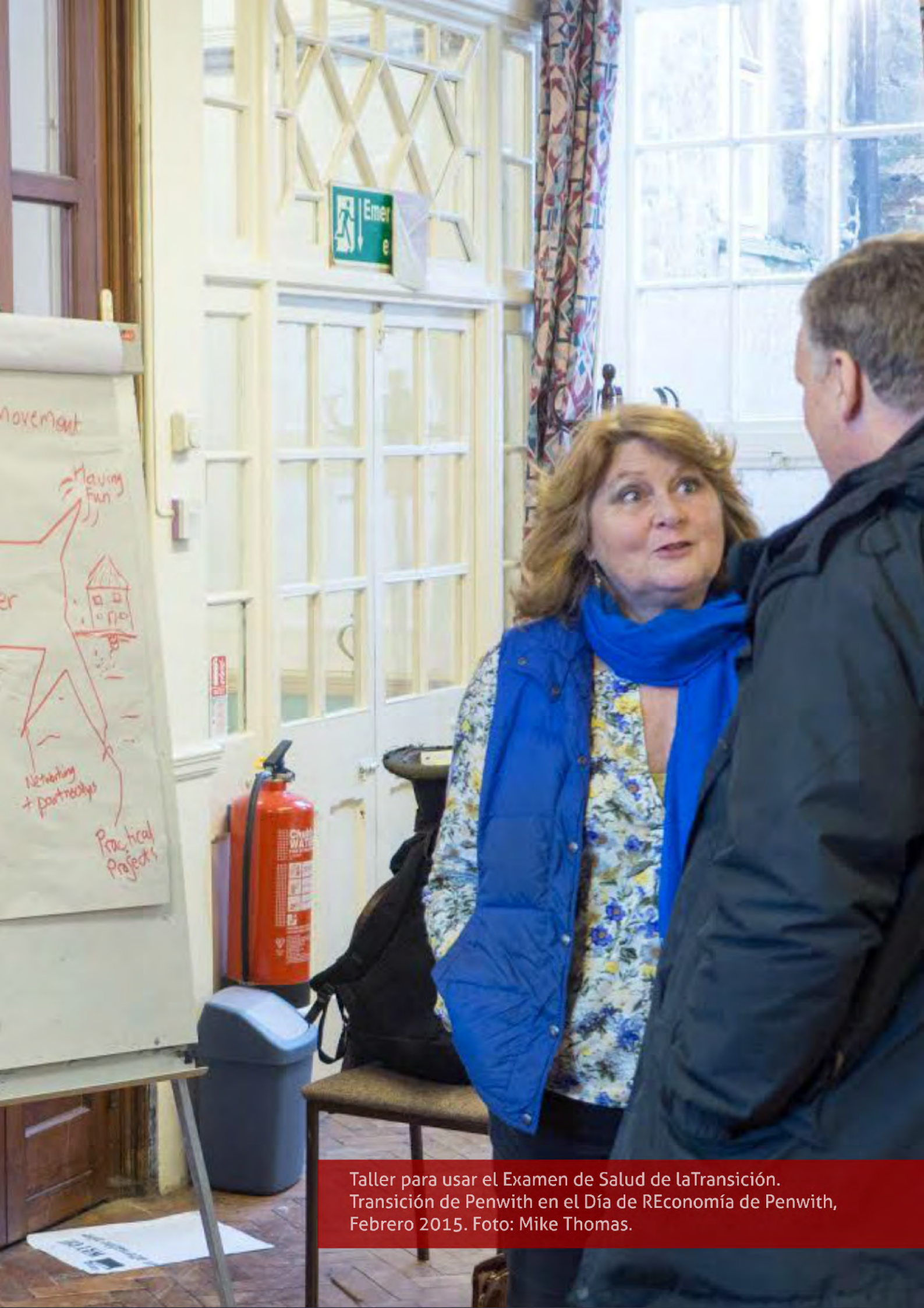
Taller para usar el Examen de Salud de la Transición. Transición de Penwith en el Día de REconomía de Penwith, Febrero 2015.