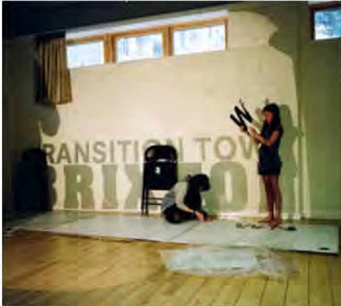
Un día de hacer en el Pueblo en Transición Bristol.

Cuando tengas a un buen grupo de personas puede que quieras cerrar el grupo, para que puedan concentrarse en trabajar juntos. Esto está bien – y tendrás que pensar en cómo las personas se retiran del grupo, y cómo se integran los nuevos.