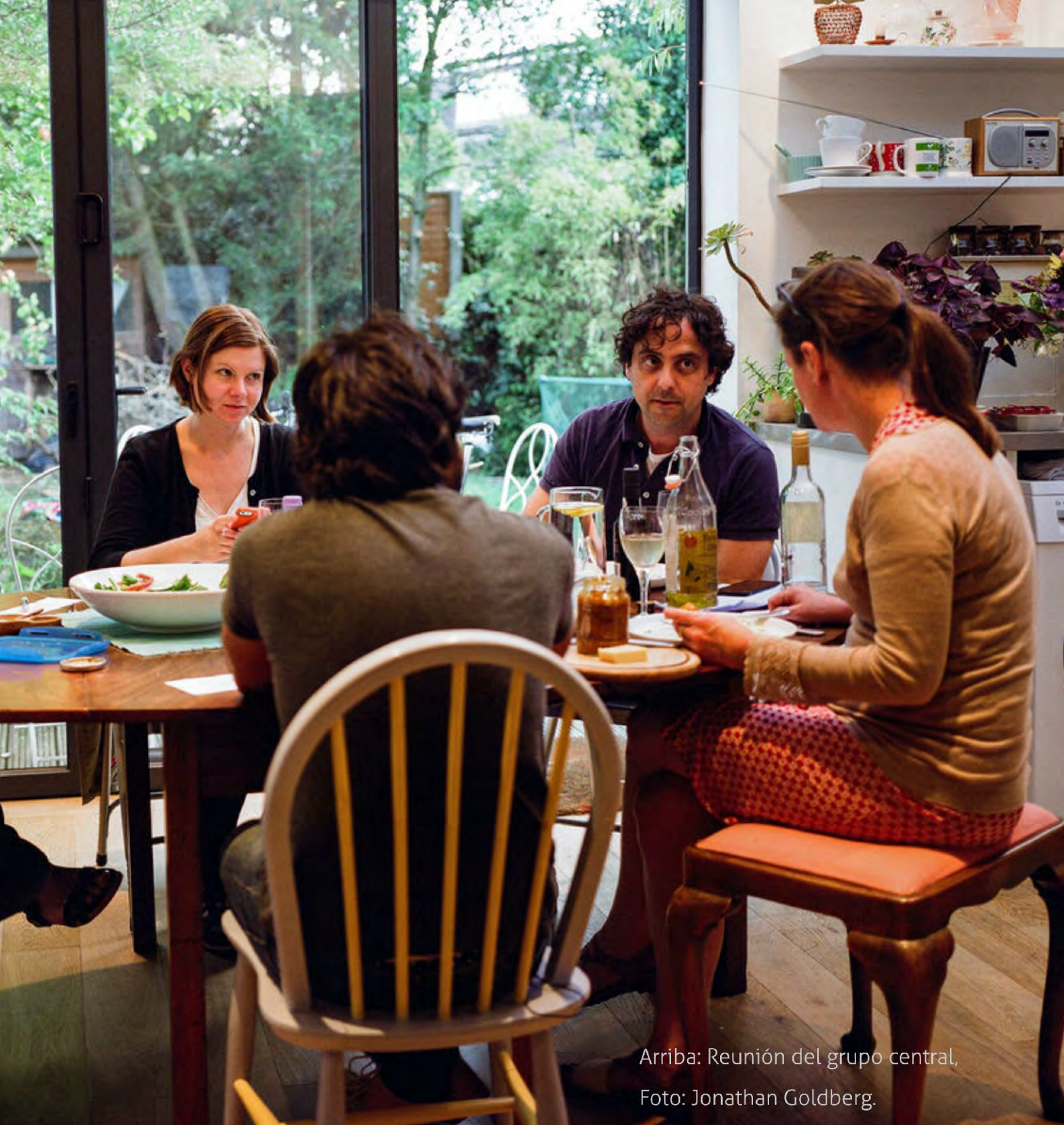
Arriba: Reunión del grupo central, Foto: Jonathan Goldberg.