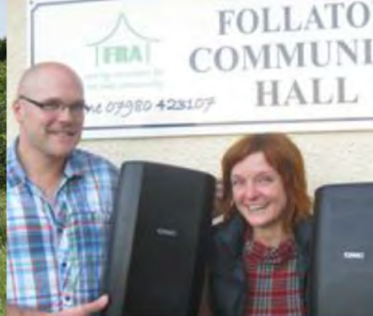
Iniciar un cine comunitario Totnes, Reino Unido