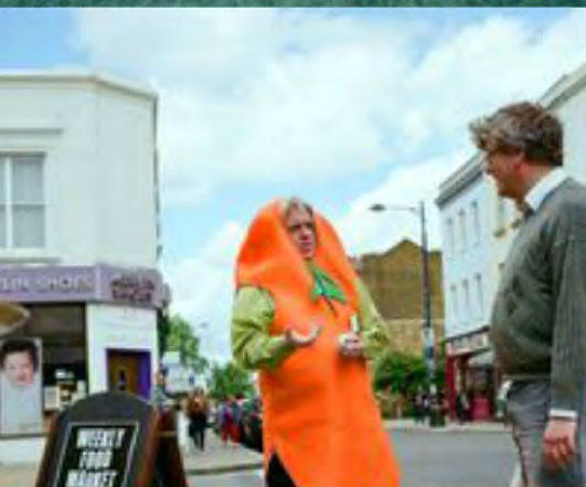
Viste como una zanahoria. Un poco aleatorio. Crystal Palace, Londres, Reino Unido