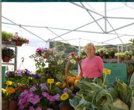
Crear un nuevo mercado de alimentos Coin, España