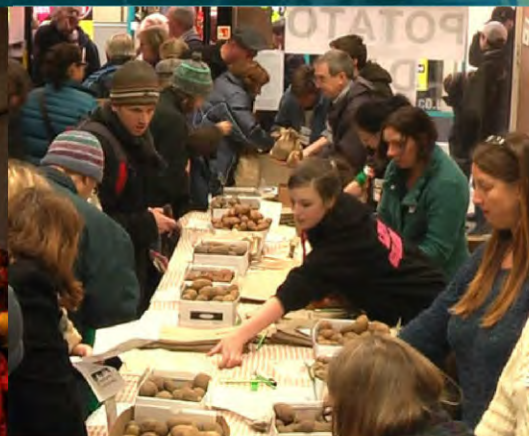
Hacer un 'Día de la Papa' Stroud, Reino Unido