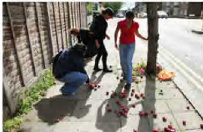
Kensal a Kilburn en Transición (Londres, Reino Unido) cosechando fruta de sus árboles frutales locales.

Si es posible, produzca un documento de descripción voluntario para el rol. Puede hacerlo para los miembros del consejo, los miembros del grupo central, los voluntarios y ayudantes, como también para los roles remunerados.