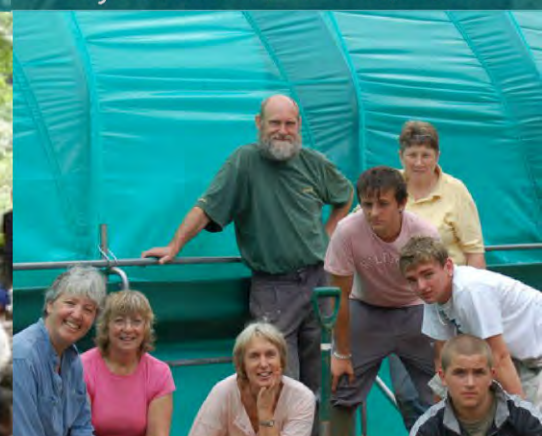
Ayudando a una escuela para cultivar alimentos Newent, Reino Unido