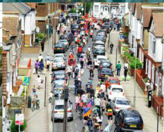
Organizar un carnaval callejero Tooting, Londres, Reino Unido