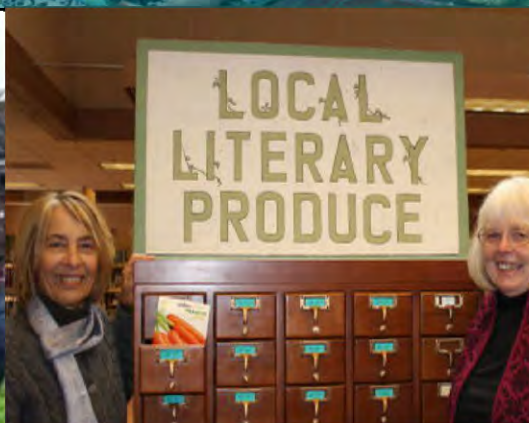
Iniciar un Banco de Semillas Healdsburg, Estados Unidos