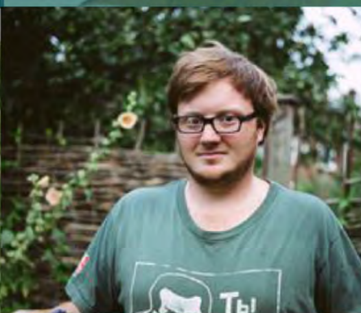
Cosecha de frutos caídos Kensal a Kilburn, Londres, Reino Unido