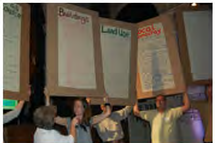
Formar grupos de trabajo en distintas áreas de interés es una estrategia muy útil.

Tenemos una guía más completa sobre cómo involucrar a nuevas personas, aquí .