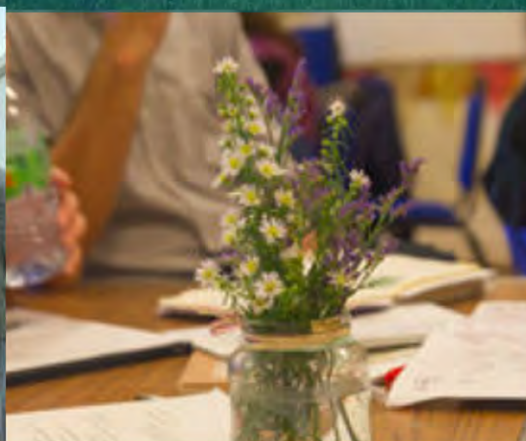
Hacer espacio para la reflexión. Universidad de St. Andrews, Escocia