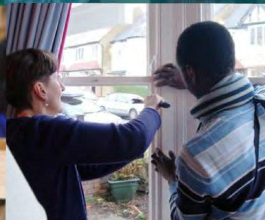
Ejecutar sesiones de 'Mata-corrientes' Brixton, Londres, Reino Unido