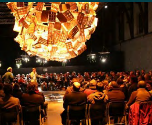
Realizar grandes eventos públicos. Lieja, Bélgica