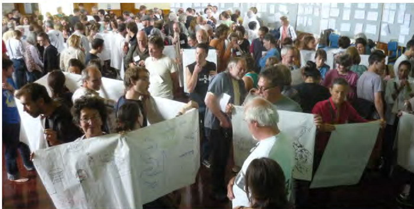
Una 'galería' de visiones de futuro obtenida de una multitud: Conferencia de la Red de Transición 2010, en Seale Hayne, Newton Abbot, Devon, Reino Unido.