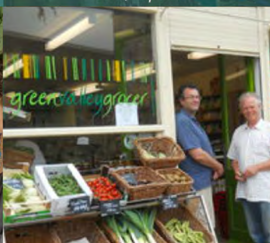
Abrir una tienda comunitaria Slaithwaite, Reino Unido