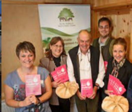
Organizar una Cumbre de Alimentos Locales New Forest, Reino Unido