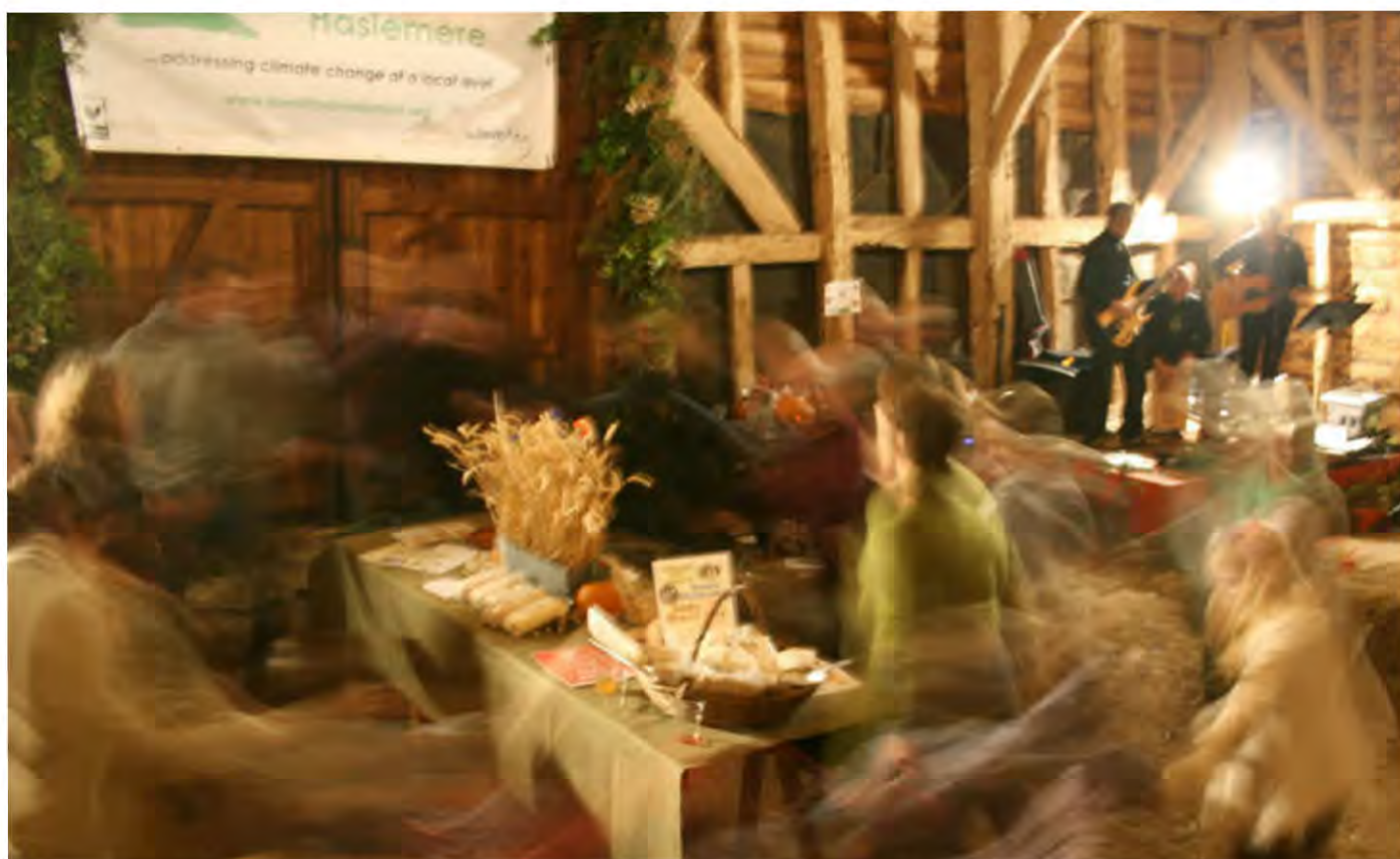
'El Picnic de Cosecha Sustentable' de Haslemere en Transición.

- Sébastien Mathieu, 1000 Bruxelles en Transición.