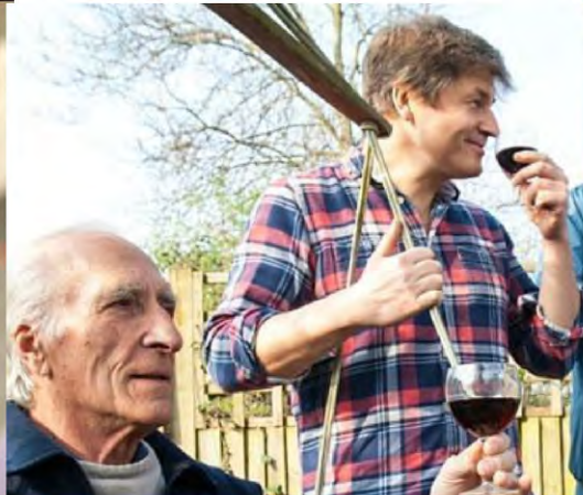
Producción de vino comunitario Kilburn, Londres, Reino Unido