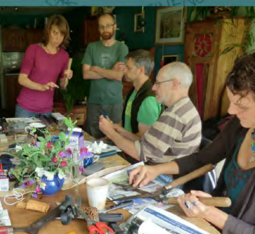
Compartir habilidades Totnes, Reino Unido