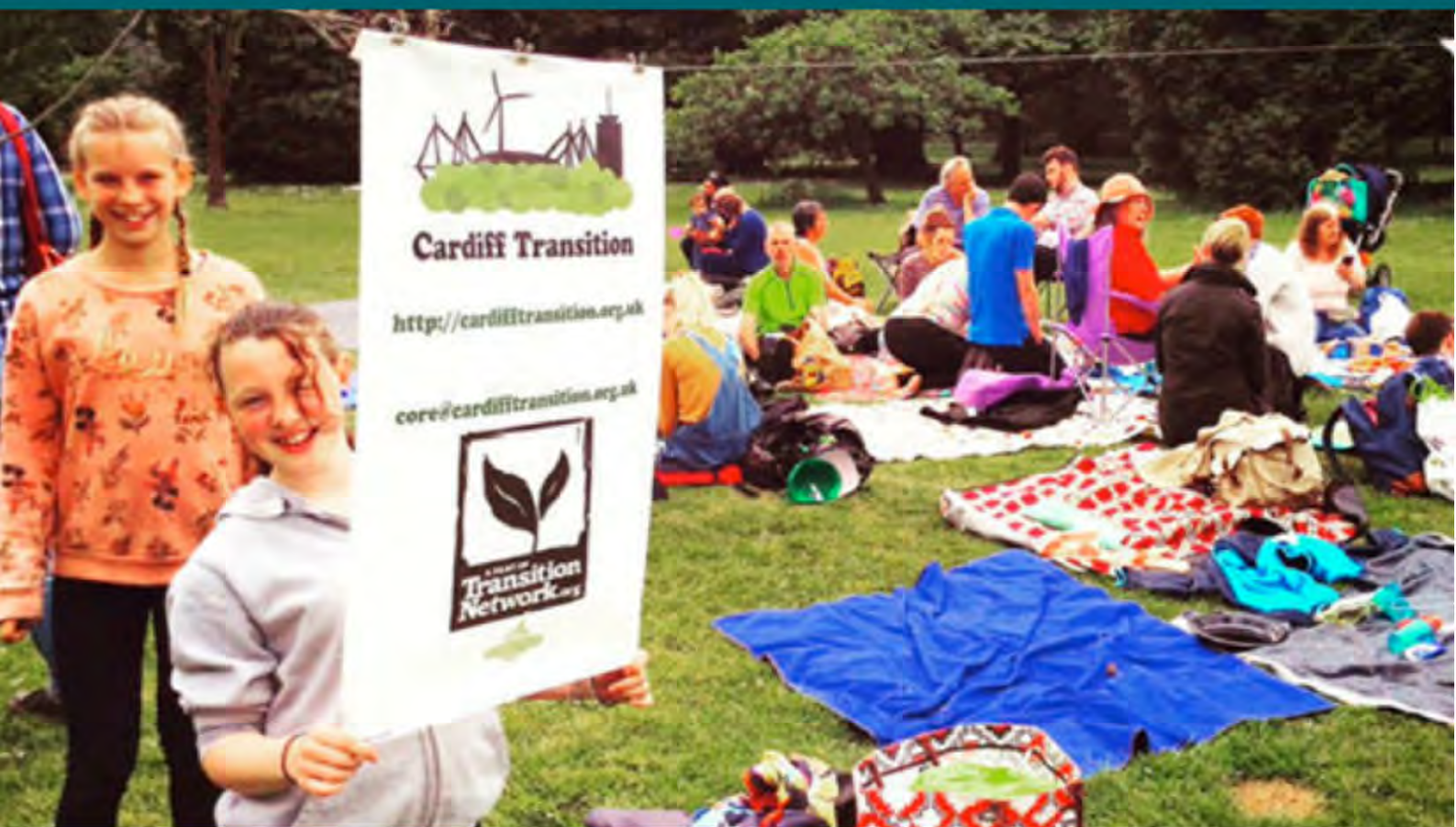
El picnic público de Cardiff en Transición fue una excelente forma de invitar al público a conocer el proyecto e involucrarse.

Hacer esto bien puede ayudar mucho a aumentar la conciencia sobre la Transición, y ayudar a las personas a entender los asuntos que la Transición aborda. También ayuda a las personas a ver que pueden realmente hacer un cambio en su comunidad, y puede inspirar a nuevas personas a involucrarse.