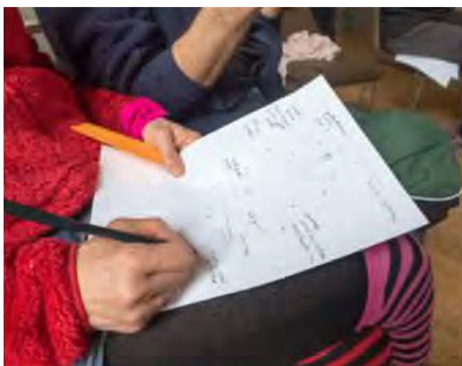
Los participantes de la Gira de Transición 2015 en Lancaster, realizando el Examen de Salud de la Transición para su iniciativa.

Cada grupo de Transición es diferente en la mezcla de personas que está involucrada, las oportunidades y desafíos de su contexto, y los eventos externos que influyen en que las personas se unan o no. Esperamos que el resultado del Examen de Salud sea que celebren lo que han logrado, más que sentirse abrumado por lo que no ha pasado. ¡Ninguna iniciativa que conozcamos pudo hacerlo todo bien!