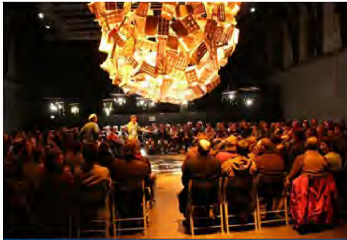
Liege en Transición lanzó su proyecto Ceinture Aliment-terre Liégeoise (Cintura Alimen-Tierra de Liege) con un gran evento público.

Para relacionarte ampliamente con tu comunidad tendrás que organizar eventos que sean inspiradores, que llamen a la reflexión y que proporcionen tantas oportunidades de interacción como sea posible.