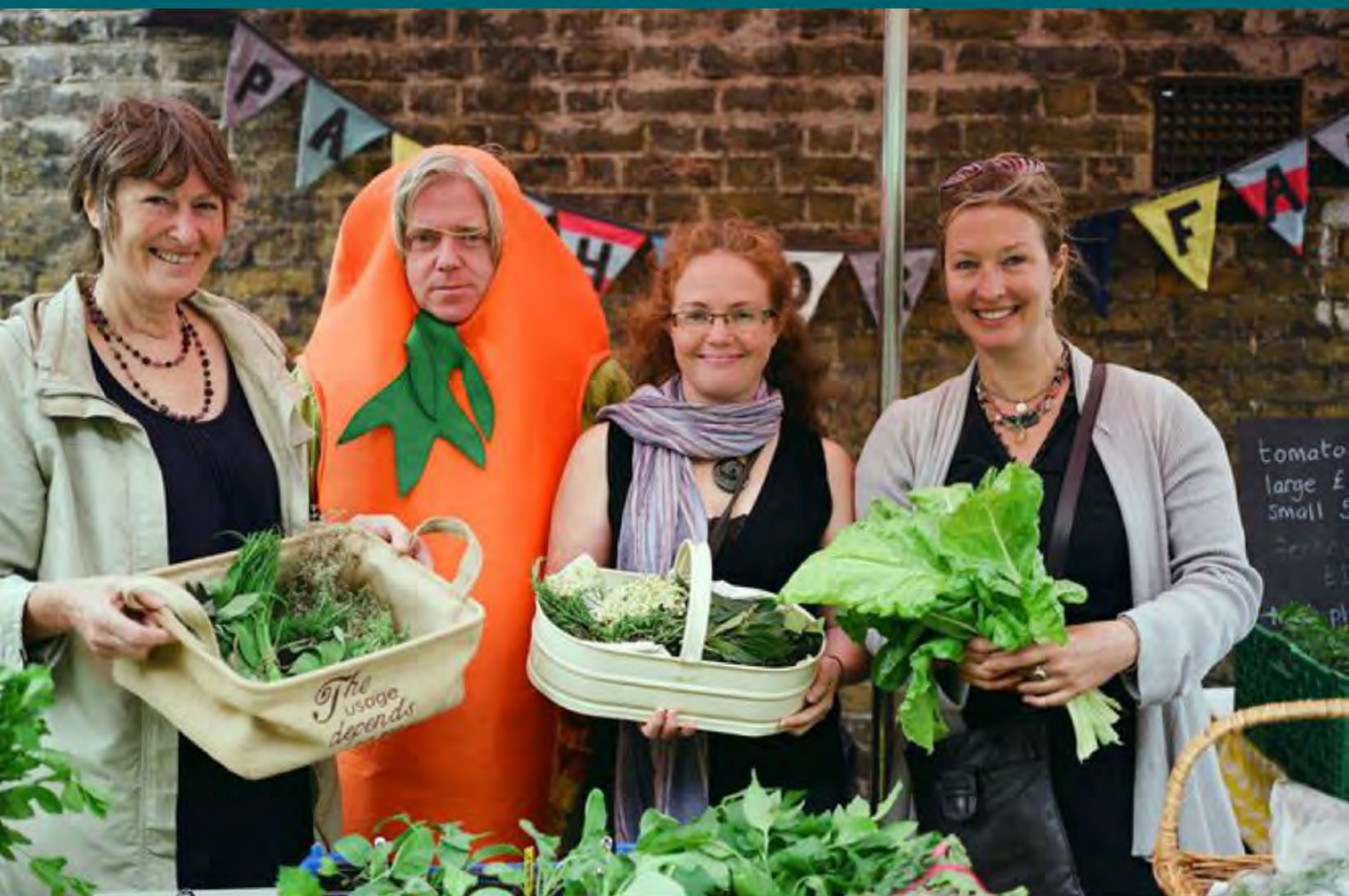
Los miembros del Pueblo en Transición Crystal Palace que formaron el Mercado de Alimentos Crystal Palace: "Queremos que los niños crezcan pensando que esto es normal".

Entonces, en el transcurso de los últimos 10 años hemos creado varios recursos que te apoyarán para co-crear una cultura grupal basada en las relaciones de confianza, compasivas y bondadosas necesarias para tomar decisiones efectivamente, convocar reuniones y eventos exitosos y estimulantes, evitar el agotamiento, navegar sanamente por los conflictos y mantener a los miembros en el largo plazo.