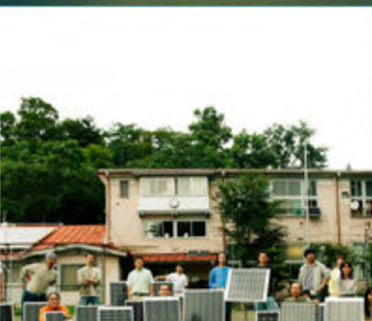
Iniciar una empresa comunitaria de energía. Fujino, Japón