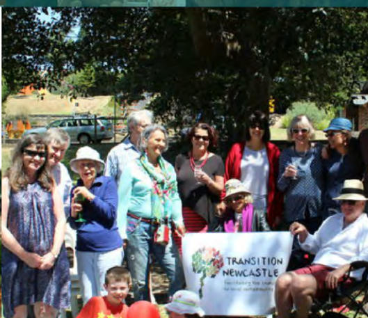
Hacer 'Calles de Transición' Newcastle, Australia