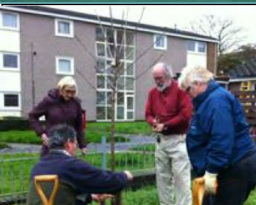
Plantar algunos árboles frutales Leamington, Reino Unido