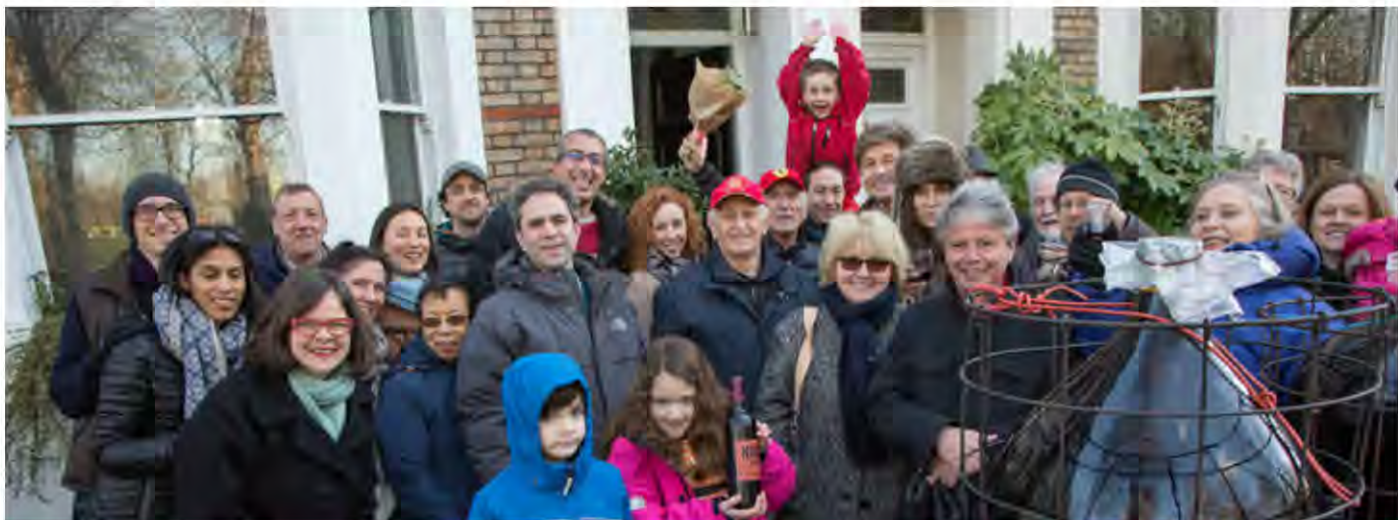
El proyecto urbano de vinificación de Kensal a Kilburn en Transición 'Unthinkable Drinkable' (Bebestible Impensable) celebra su primera degustación del producto final.

¡Felicitaciones! Tu grupo ya está en marcha y funcionando. Se siente bien ¿no? A estas alturas puede que te encuentres haciendo conexiones con organizaciones, grupos e individuos que apoyan, encontrando formas de realizar eventos juntos y promover el trabajo de unos y otros, además de construir un Grupo de Inicio de la Transición para que sea efectivo en su trabajo conjunto.