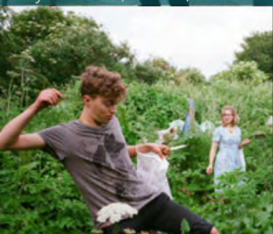
Aprender a forrajear Transition Heathrow, Reino Unido