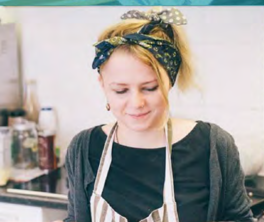
Crear un Café de Excedentes de Alimentos Fishguard, Reino Unido