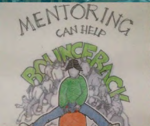
Mentoría para el agotamiento Totnes, Reino Unido