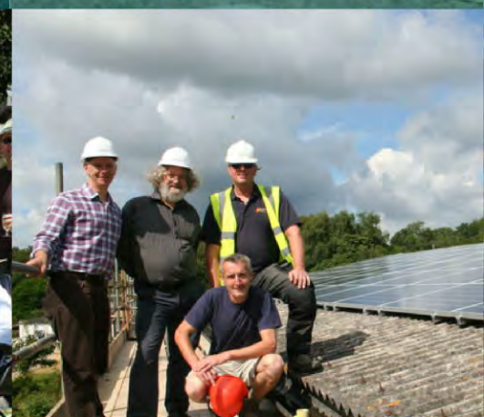
Invitar a la comunidad a invertir en energías renovables Lewes, Reino Unido