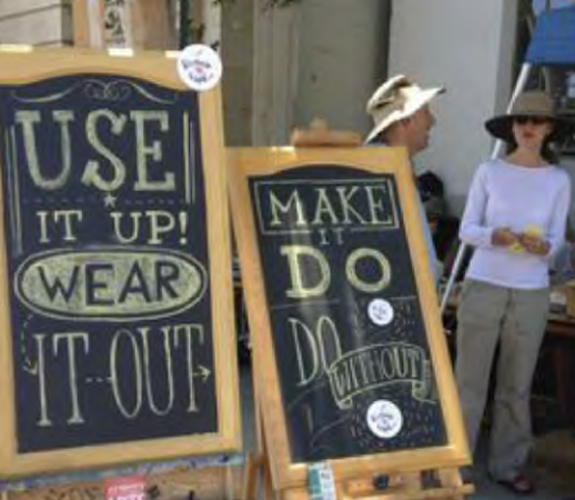
Iniciar un Café de Reparaciones Pasadena, Estados Unidos