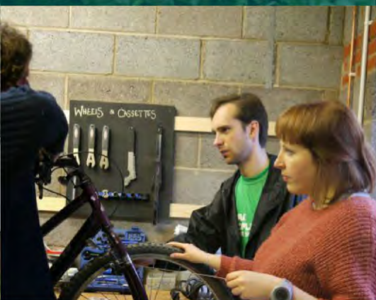
Ofrecer reparaciones gratuitas de bicicletas Usk, Gales